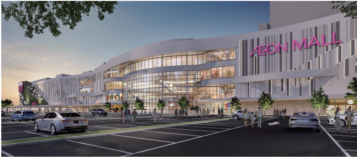
<Hình ảnh bên ngoài>